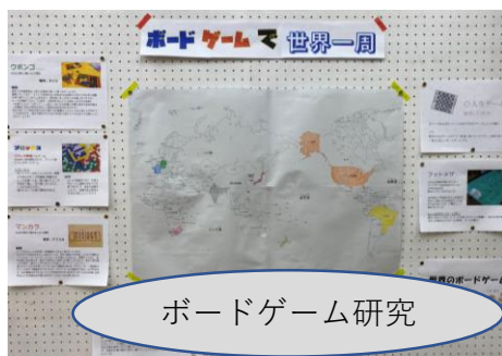
ボードゲーム研究